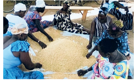
Femmes de la province de Zoundwégo triant le riz

Une jeune écolière attablée avec sa grand-maman côtoie deux couples du quartier et un monsieur. Il connaît un peu le Burkina Faso, a vu l'affiche annonçant la «Soupe solidaire» et prend plaisir à partager ce moment. À notre table, la conversation s'anime au contact de deux jeunes filles au pair, la première est de Morat, venue en compagnie de sa famille d'accueil, la seconde vient de Cologne, en Allemagne. Elles se sont connues lors des activités, notamment un cours de français, proposées par l'association locale des jeunes filles au pair. Leur français atteint déjà un niveau très enviable, «félicitations!» et parfois un mot ou une expression en allemand se glisse de part et d'autre dans la conversation. Maintenant