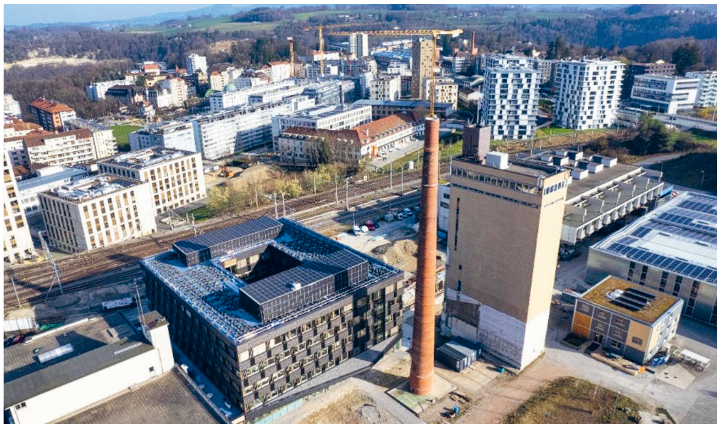
Vue d'une partie du quartier avec le tout nouveau Bâtiment B et sa façade en bois brûlé.

Validé en juillet 2018, le Plan d'affectation cantonal (PAC) donne son sésame pour transformer le site de l'ancienne Brasserie Cardinal en un quartier d'innovation. Petit détour par bluefactory, notre voisin, le temps d'une discussion avec Philippe Jemmely, directeur de BFF SA depuis 2016.