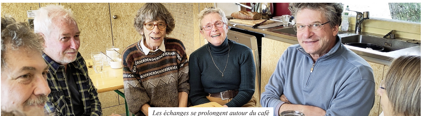
Les échanges se prolongent autour du café