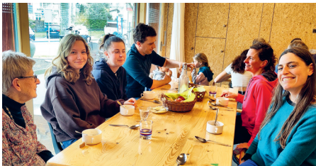
Toutes les générations se retrouvent à la «Soupe solidaire»

Un vendredi par an, en mars ou avril, le Kiosque convie à la «Soupe solidaire» entre midi et deux heures. L'initiative repose sur une collaboration avec la Soupe de carême de la paroisse Saint-Pierre, en solidarité avec un projet développé dans un pays du Sud global. Petites et grandes personnes s'asseyent autour de la table pour manger la soupe, converser et échanger, parfois faire connaissance ou partager une expérience de vie dans le pays où se déroule le projet. Vers la sortie du Kiosque est suspendue une tirelire en carton «À votre bon cœur»; elle reçoit les participations et dons à l'attention du projet. À l'extérieur, un panneau fournit les explications quant aux porteurs du projet et à leurs objectifs.