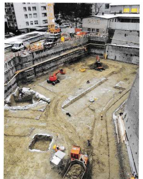
Décembre 2017, la fouille est terminée, qui doit accueillir la salle de sport et un abri antiatomique de 400 places.