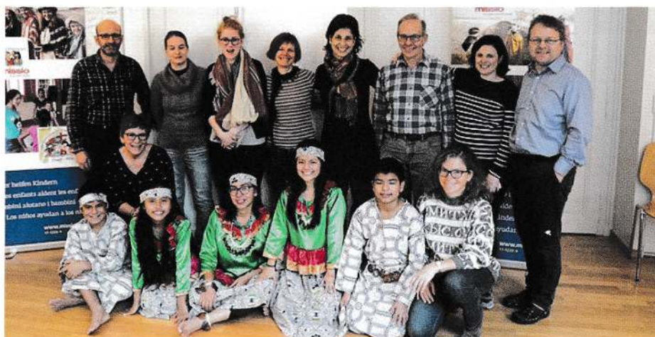
Gruppenfoto vom Missio-Team zusammen mit einer Jugendgruppe aus Iquitos, Peru, die im November und Dezember in der Schweiz unterwegs war.