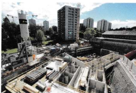
Au printemps 2018, les fondations sont jetées, prêtes à projeter le circonflexe vers le haut. (Photo: Page Architectes SA)

fantines, et 81 m 2 pour les classes primaires. L'équipement didactique prévoit des vidéoprojecteurs interactifs pilotés par leur station de travail dédiée, intégrée au bureau de l'enseignant. «Chaque salle aura un code couleur particulier: les couleurs des sols et des murs peints se déclinent selon une gamme qui évoque le design scandinave – orange, jaune, violet ou vert pastel, explique la cheffe de projet, alors que les plafonds seront blancs, traités avec un revêtement acoustique.» L'édifice répond aux normes Minergie P imposées pour les bâtiments publics du Canton. Ce type de construction, très bien isolé et très étanche – vitrage triple, priorisation des énergies renouvelables, etc. – nécessite un contrôle efficace de l'atmosphère ambiante, ce d'autant plus que les surfaces vitrées sont très importantes – plus de 500 m 2 plein sud! Deux équipements spécifiques contribueront au fil des saisons à maintenir un climat agréable, propice à l'étude: d'une part une ventilation double-flux qui pulsera de l'air frais – mais pas conditionné – tout en évacuant les masses viciées et humides; et