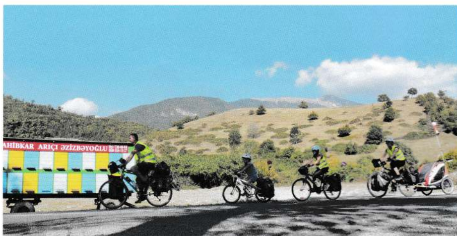
Sur une route d'Azerbaïdjan.

Propos recueillis par Jean-François Paccolat