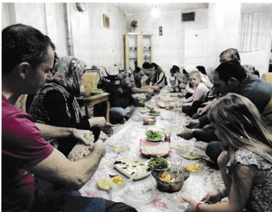
Repas dans une famille rencontrée à Ispahan.