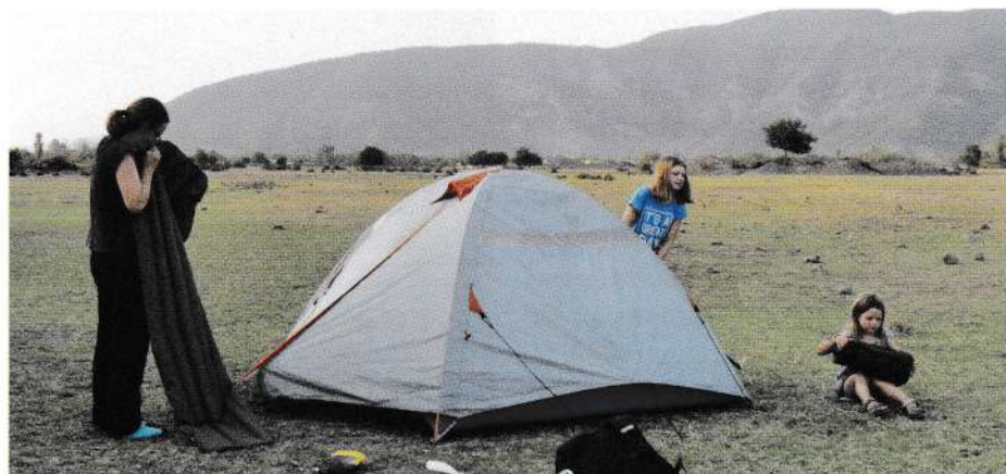
Au pied du Caucase en Azerbaïdjan.

Grandiose en Géorgie, Azerbaïdjan et Iran. Nous avons commencé à écrire une liste de tous les cadeaux et invitations que nous recevions au quotidien. Il y en avait tellement que nous avons arrêté. Des kilos de fruits, de la nourriture, des invitations à boire le thé, à dormir, à partager des repas, des barbecues avec la famille élargie, à visiter des écoles, à chanter, à aller à un mariage... Le programme de la journée était soudainement bien chargé dans ces conditions. En Inde et au Népal, cela a été un peu différent. Nous avons eu moins d'opportunités d'être invités. Il y avait moins de spontanéité dans les rencontres.