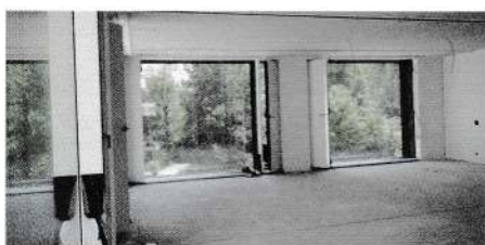
En phase de finition, les salles aux extrémités du bâtiment présentent des ouvertures sur deux parois.

d'autre part un châssis supplémentaire sur les orientations ouest, sud et est, composé d'un vitrage à fleur de façade protégeant un rideau amovible qui laisse passer la lumière, mais protège du rayonnement solaire. «Un édifice à Belmont-sur-Lausanne utilisant ce même type de protection a été visité par la commission de bâtisse, et aucun des usagers actuels n'a fait mention de problème de surchauffe», assure M me Fragnière. Dans le bâtiment D, nos chères têtes blondes pourront donc synthétiser un maximum de vitamine D bien à l'abri des coups de chalumeau.