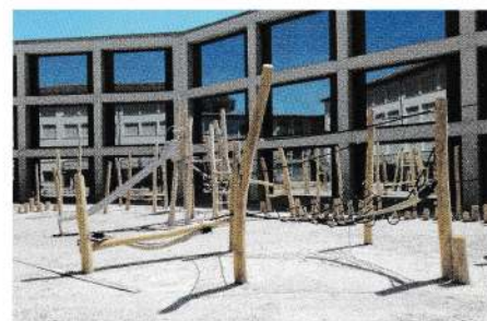
Finition d'aspect naturel pour les jeux de la cour principale.