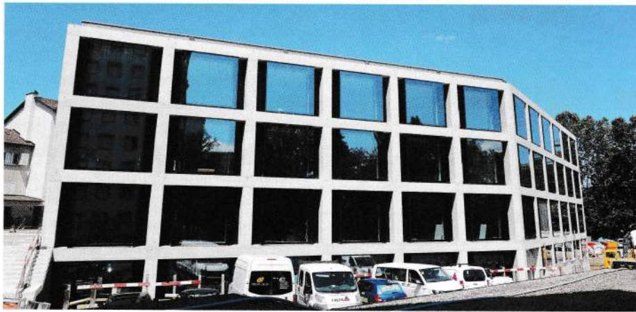
L'imposante façade sud, dont les généreux vitrages reflètent le bleu du ciel.

D'une capacité maximale de 340 élèves, le nouveau bâtiment D du site scolaire de la Vignettaz sera opérationnel cet automne. Petit tour du propriétaire alors que l'on en est au stade des finitions et que le compte à rebours est lancé.