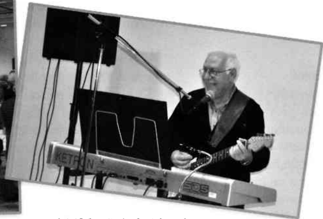
Apéritif des Rois, le 8 janvier