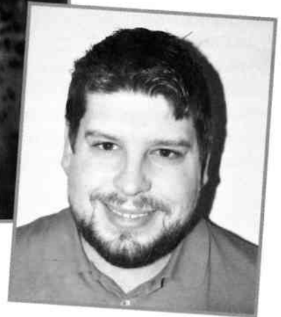
Assemblée générale de l'ancien ... au nouveau président, le 28 janvier