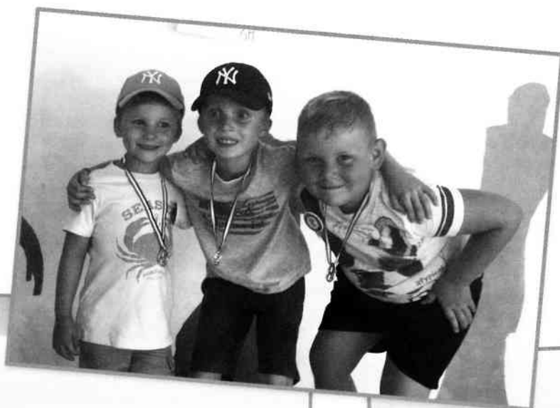
Fête du quartier, le 9 juillet