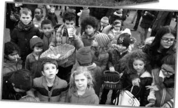
Chasse aux oeufs, le 28 mars