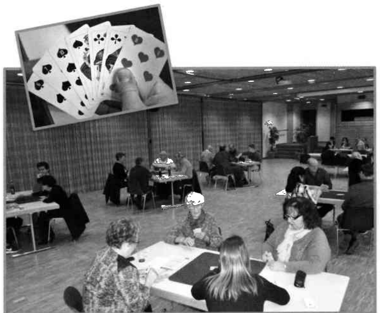
Match aux cartes, le 12 novembre