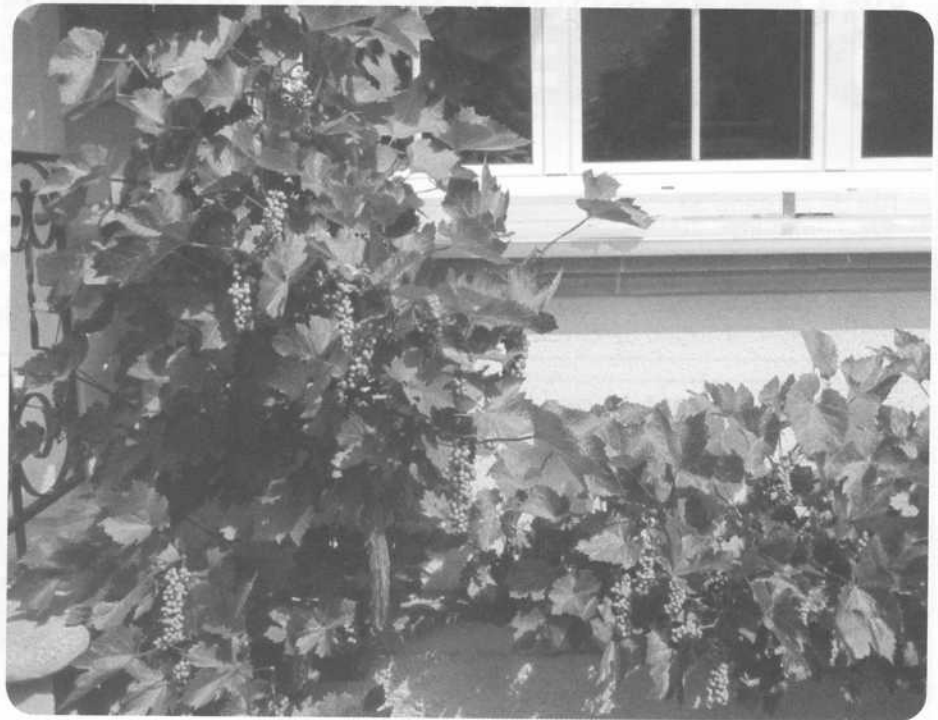
La promesse d'une belle récolte

Vignoble ou pas, la réalité a rattrapé l'histoire puisque l'on y trouve aujourd'hui quelques plants de vigne, montant ici nonchalamment le long