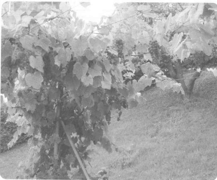
En plein vent, en attendant l'automne