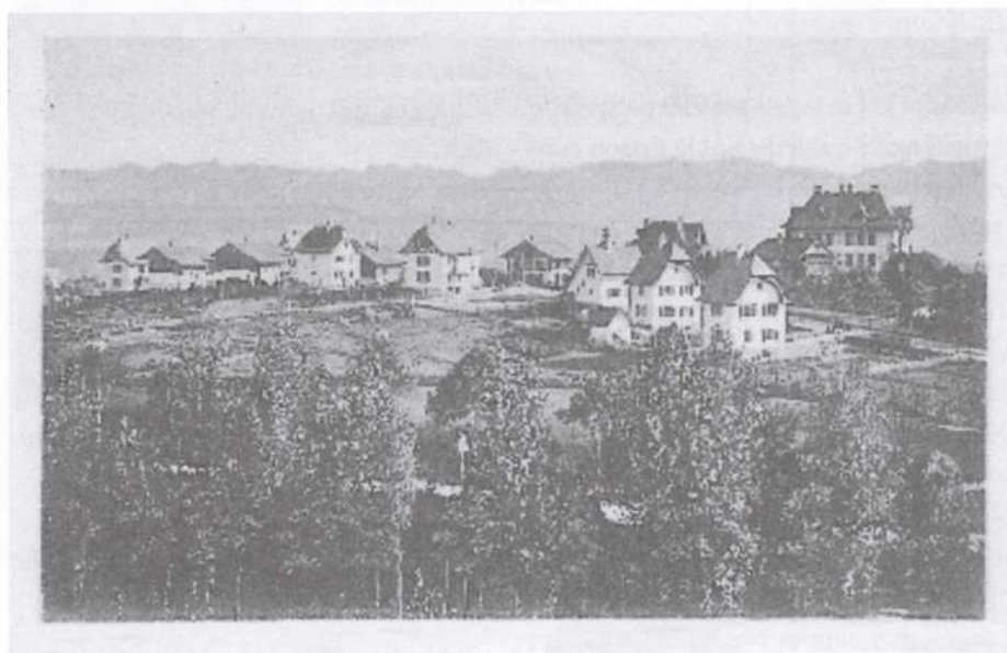
Le quartier de la Vignettaz à la fin des années 1920; photo prêtée par Jean-Marc Etienne.

Le nom de ce lieu-dit apparaît dans des documents datés de l'an 1372 sous la forme d'un acte notarié – en fait une transaction foncière – détaillant les parcelles aliénées, groupées autour du hameau de Piroules (Pérolles), dont quelques poses sises en la Vignettaz . Mais en dépit de ce nom, on n'y trouve hélas pas traces de plants de vigne, mais simplement de la terre à cultiver ou de l'herbe à faucher ! Malgré son exposition idéale, on pourrait conclure qu'à cette époque tout au moins on avait