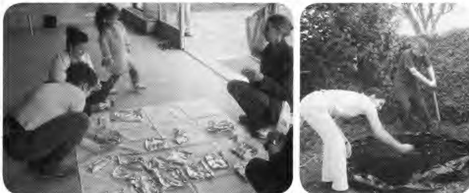
Illustration des « Journées Portes Ouvertes » des 26 et 30 octobre 2013.

« La Maison des Générations Futures » qui se veut être un lieu de rencontre, a pris ses quartiers dans le local de l'école maternelle « Les Petits Bancs », route de la Veveyse 5a, à Beaumont.