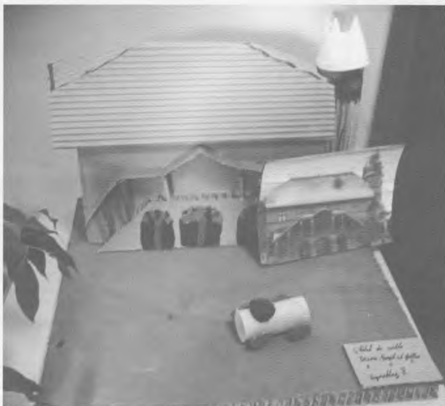
Reconstitution de l'Hôtel de Ville avec du carton et des objets de récupération

O bjectif atteint pour la première «Semaine créative» organisée à l'école du quartier. Près de 300 élèves de tous les degrés ont appris à mieux se connaître, et à mieux connaître leur ville.