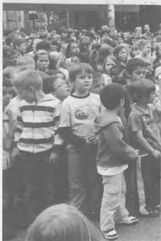
Moment intense: francophones et alémaniques unissent leurs vo-

Malgré une logistique complexe – il a fallu répartir 296 enfants de tous les degrés, école enfantine comprise, dans les groupes en tenant compte si possible des intérêts de chacun, et en veillant aussi au savant mélange entre romands et