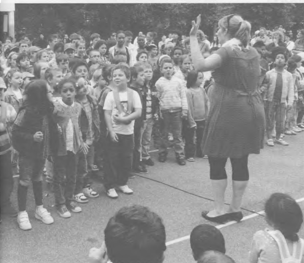
pour déclamer leur amour à Fribourg