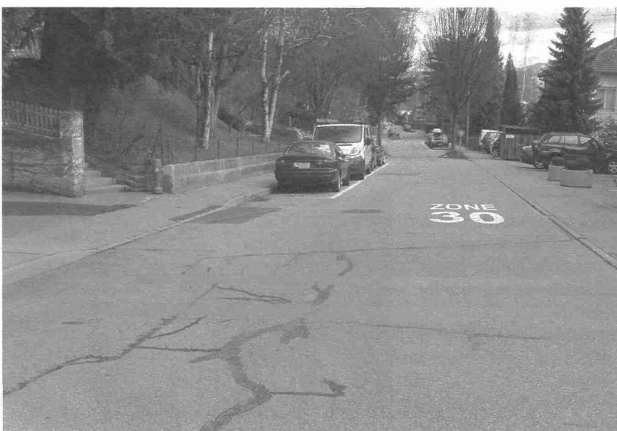
Route du Fort St-Jacques: bandes de ralentissement, marquage au sol de la zone 30, stationnement alterné, rétrécissement avec seuil de ralentissement

sources: Touring Club Suisse; ordonnance fédérale sur les zones 30 et zones de rencontre; Service de la circulation de la Ville de Fribourg.