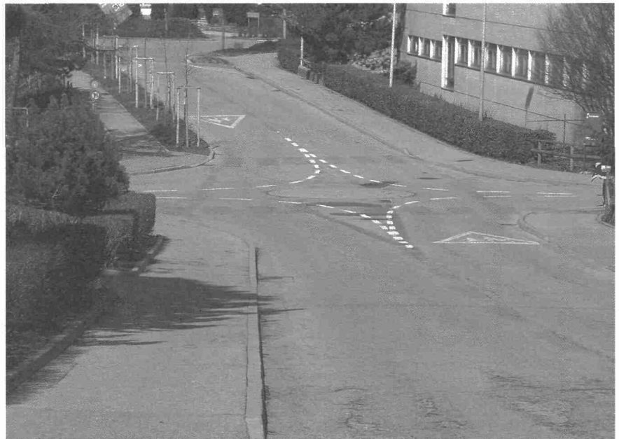
Route de la Gruyère: priorité de droite; ce n'est pas un giratoire!

La zone 30 est maintenant familière aux habitants du quartier de Beaumont-Vignettaz. Il demeure parfois quelques doutes utiles de dissiper. Au carrefour de la route de la Gruyère/route du Levant/route du Châtelet, le Service de la circulation de la Ville a fait poser une «pastille»