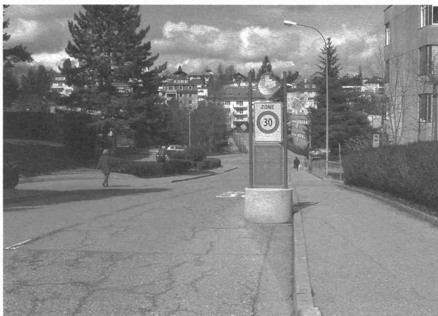
Route de la Gruyère: porte d'entrée de la zone 30

Piétons: dans les zones 30, les piétons ne sont pas prioritaires sur les véhicules. L'aménagement de passages pour piétons n'est pas admis. Il est toutefois permis d'aménager des passages pour piétons lorsque des besoins de priorité spéciaux en faveur des piétons l'exigent, notam-