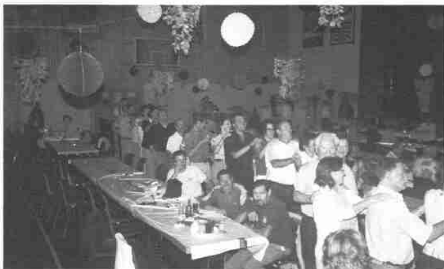
Le tour des tables après le tour de piste.

En début de soirée, le Trio Soleil lança ses notes musicales, appelant ainsi les danseurs à faire leurs premiers pas sur la piste de la salle de gymnastique. Dedans et dehors, les bars accueillèrent leurs clients en