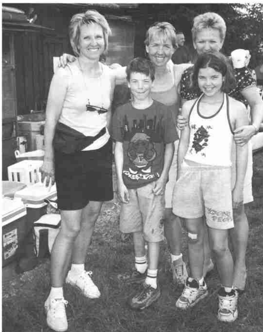
Joyeux sourires après l'effort.

Sans chronométrage ni classement, cette balade se déroula librement et au rythme de chacun. Aux premiers arrivants, l'apéritif fut servi en fin de matinée. Il fut suivi d'un repas collectif à la cabane de «Robin des Maraîchers». L'effort fourni mit petits et grands en appétit; la déshydratation due à l'effort soutenu fut compensée par des boissons ra-