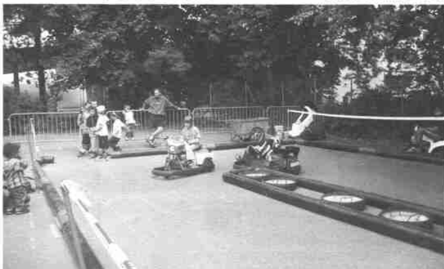
Conduite tranquille pour jeunes pilotes.