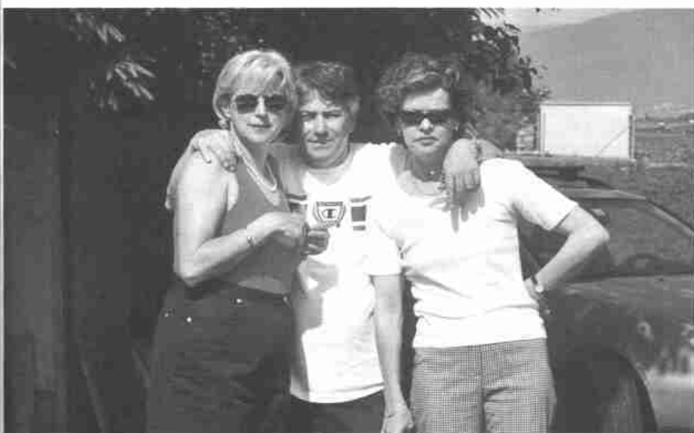
Un président bien entouré.