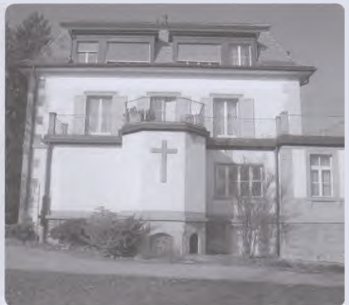
La Maison Bethléem en 2012