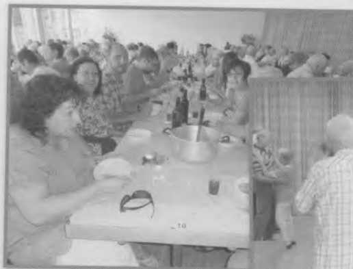
6 - La Bénichon, le 9 septembre