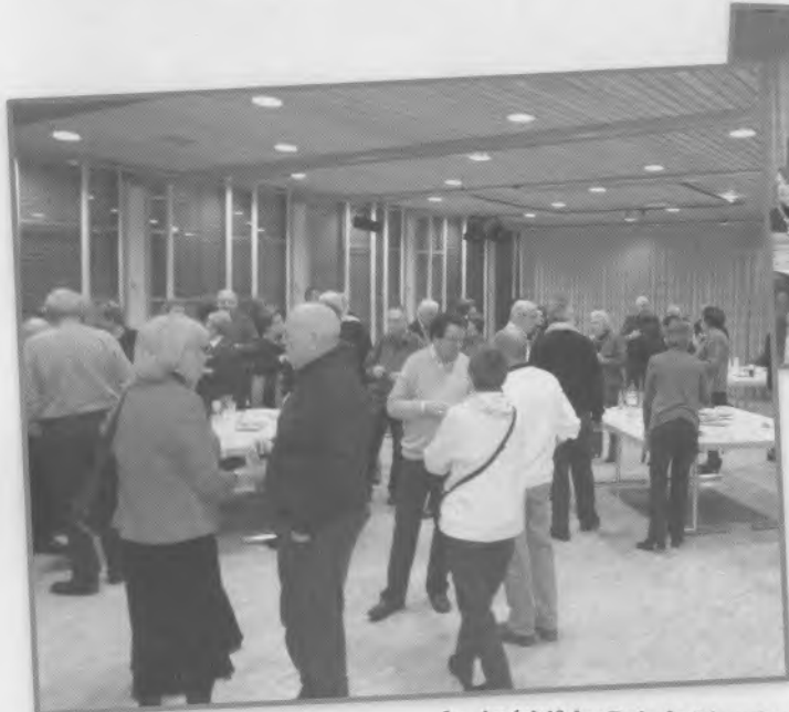
1 - Apéritif des Rois, le 6 janvier