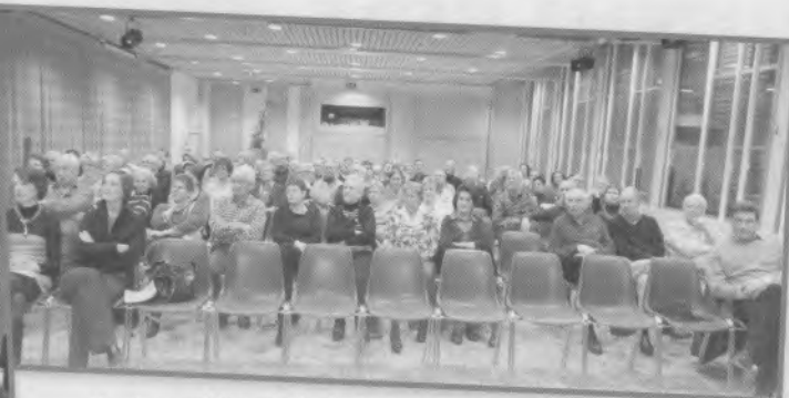
2 - Assemblée générale, le 25 janvier