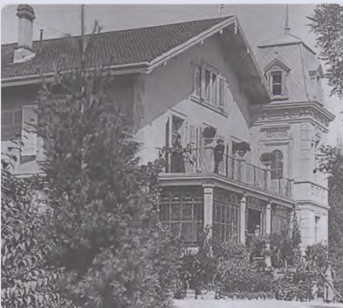
La Maison Bethléem en 1930. La tour a été démolie lors des travaux de 1958