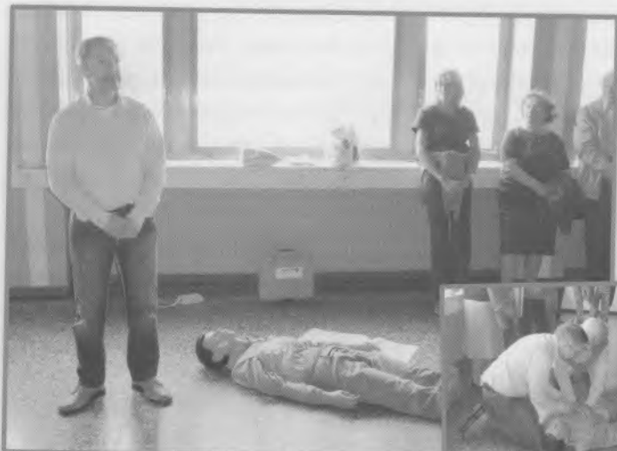
3 - Inauguration du défibrillateur, le 13 mai