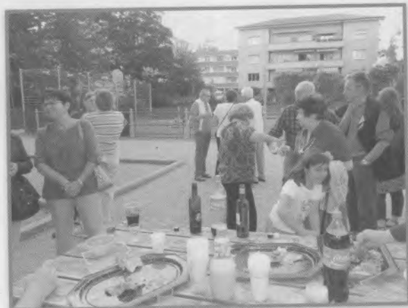
5 - Fête des voisins, le 25 mai