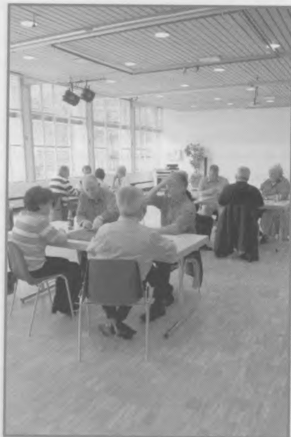
4 - Match aux cartes, le 19 mai