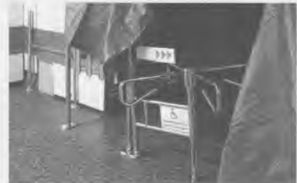
Le Satellite Denner n'a pas supporté le tourniquet de faillites successives.

Dernièrement, sous l'impulsion de l'Association des intérêts du quartier, un important groupe helvétique à la tête d'une chaîne de magasins de détail est venu visiter les lieux. Qui ne répondent pas à ses critères – trop grand, trop cher, trop vieux. Il s'est en revanche intéressé à un local plus petit, mais attend des précisions quant à l'application de clauses de non-concurrences existant entre les diverses surfaces commerciales. Une nou-