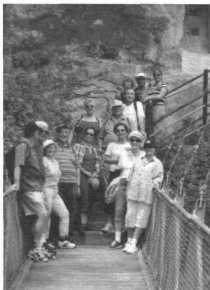
La passerelle des Neigles: terme de cette agréable randonnée.