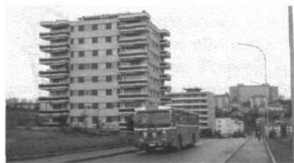
Inauguration de la ligne desservant Beaumont.

Le 20 décembre 1932 déjà, le Conseil communal a été invité à intervenir auprès des tramways pour obtenir le prolongement de la ligne de Bearegard jusqu'à Vignettaz. La commune a répondu qu'il était difficile de demander à la compagnie des travaux dont le rendement n'était pas certain.