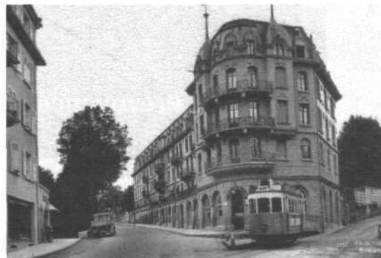
Le tram devant l'arrêt du Beausite.

Axe Torry - Beaumont. Ce n'est que le 27 mai 1974 que les autobus relient le quartier de Torry avec la place Georges-Python. Depuis le 1er décembre 1976, cette ligne est prolongée jusque dans le quartier de Beaumont (2 km). Depuis la place Georges-Python, elle rejoint la gare, traverse le passage inférieur et suit l'avenue du Midi, puis la route