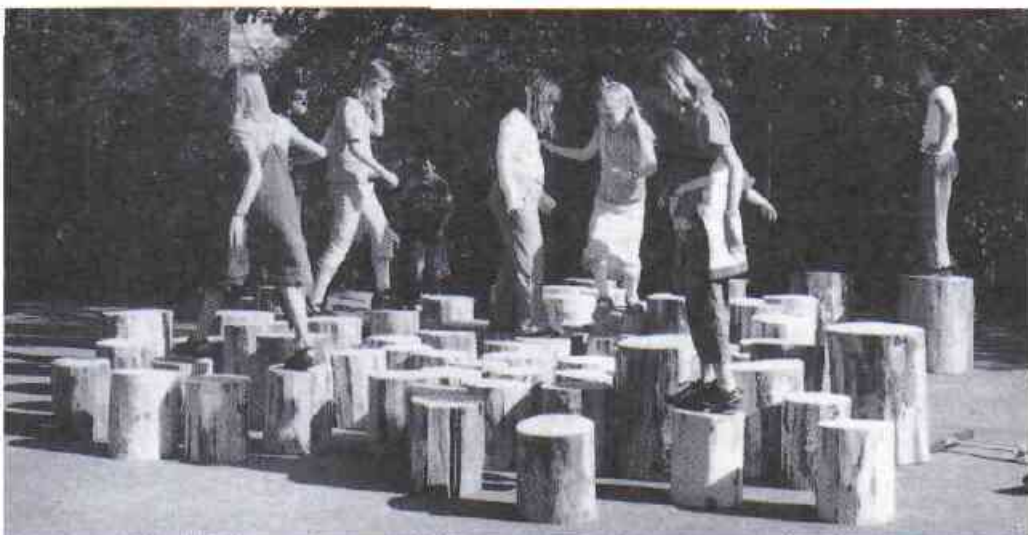
Le succès des rondins dans la cour de récréation du 11 mai dernier.

S ous le soleil éclatant du 11 mai dernier, la cour de récréation de l'école a accueilli plusieurs centaines de personnes (parents, enfants et représentants des autorités de la Ville de Fribourg). Le but de la manifestation organisée par le groupe de travail «Cour de récréation de l'école de la Vignettaz» était, d'une part, de sensibiliser la population aux différents problèmes d'aménagement et de sécurité liés à la cour d'école et, d'autre part, d'intensifier les contacts établis avec la Ville de Fribourg. Dans le but de faire avancer les choses, une pétition a même été lancée.